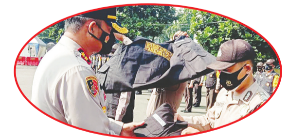
Penyerahan rompi kepada satuan Babinkamtibmas.

BANDUNG (IM) - Masyarakat Tionghoa Peduli (MTP) Bandung dan PSMTI (Paguyuban Sosial Marga Tionghoa Indonesia) Jabar di masa pandemic corona terus melakukan berbagai aksi sosial. Sehingga masyarakat terus menyatakan rasa syukur yang mendalam kasih atas semangat kerja pimpinan dan anggota ormas tersebut juga antusias menyumbangkan banyak dana untuk mendukung aksi tersebut. Tim MTP Bandung pada Rabu (23/12) lalu menyerahkan bantuan yang terdiri dari 3 kardus