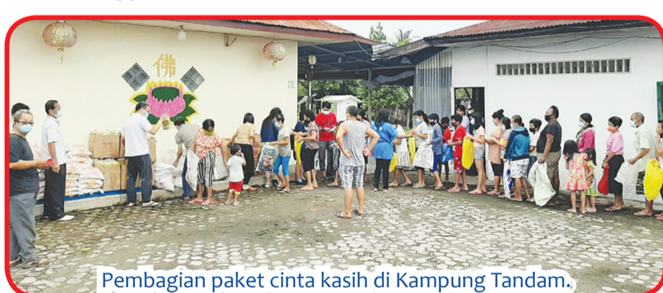
Pembagian paket cinta kasih di Kampung Tandam.

Di lokasi ini dibagikan 88 paket cinta kasih pada pukul