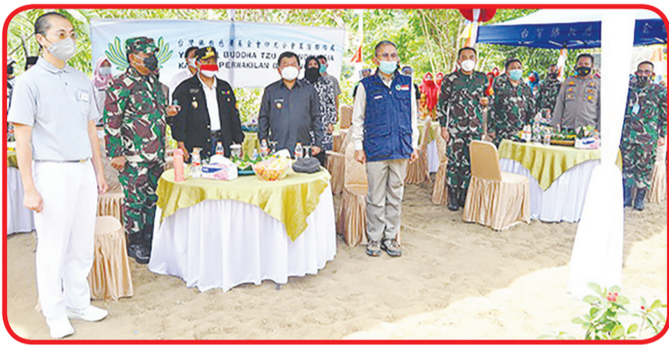
Para hadirin berdiri bersama menyanyikan lagu kebangsaan Indonesia Raya.