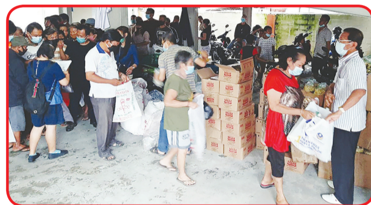
Pembagian paket cinta kasih di Sekolah Iskandar Muda di Sunggal.