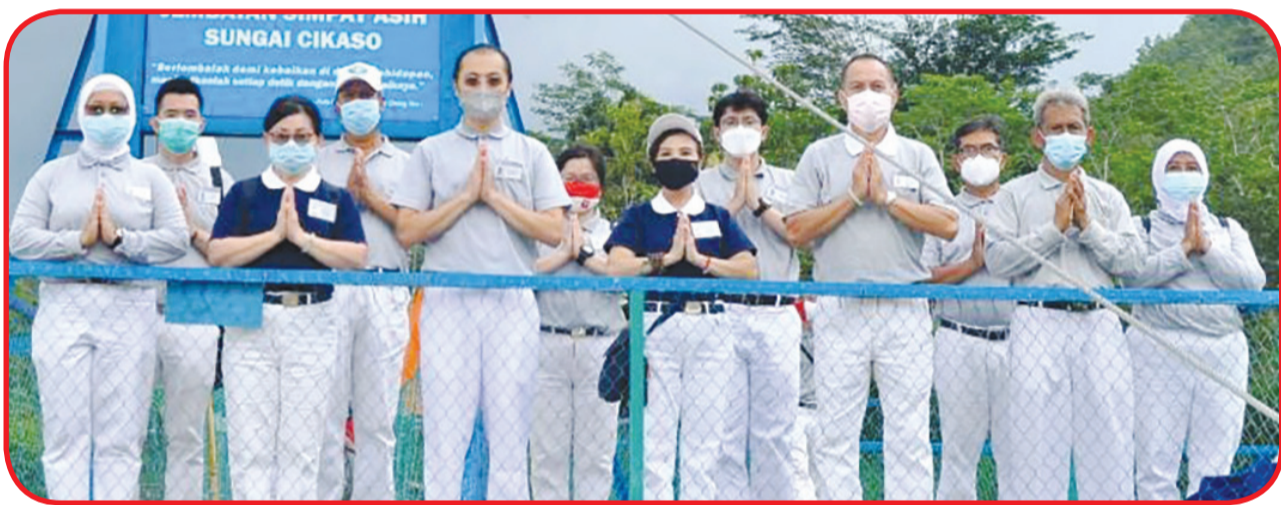
Para relawan Yayasan Tzu Chi berfoto bersama di atas Jembatan Sungai Cikaso.

GARUT (IM) - Jembatan Sungai Cikaso yang menjadi penghubung Kecamatan Cisompet dan Kecamatan Pameungpeuk, Garut, Jawa Barat yang sebelumnya sempat roboh akibat banjir bandang beberapa waktu yang lalu, kini jembatan tersebut kembali dibangun dan telah diresmikan, Rabu (6/1).