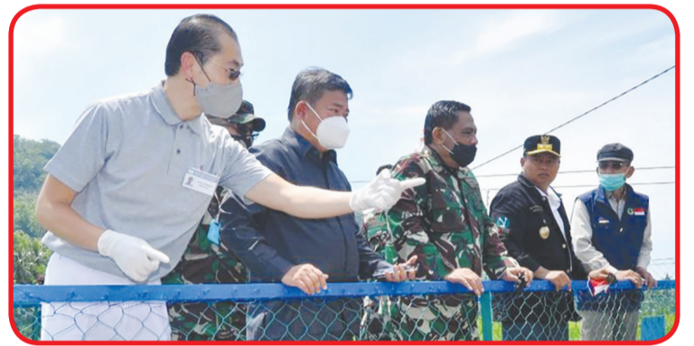
Peninjauan lokasi Jembatan Sungai Cikaso.