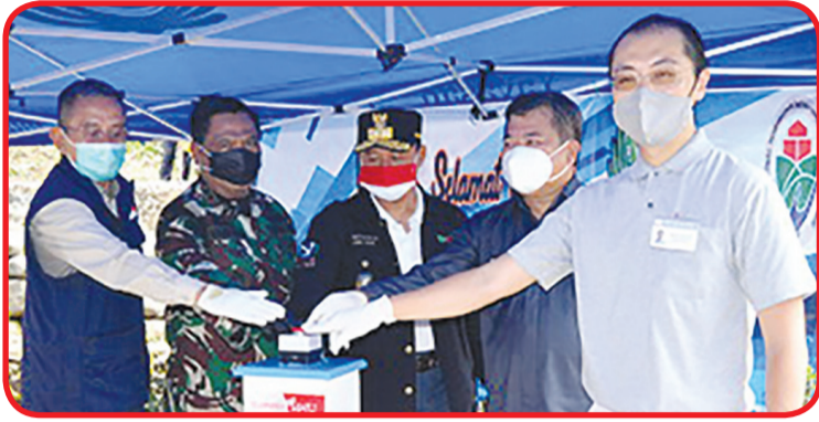
Penekanan tombol peresmian Jembatan Sungai Cikaso.