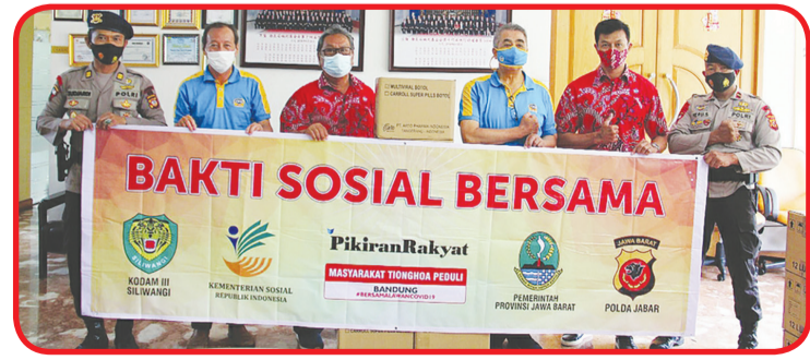
PSMTI Jabar dan tim MTP Bandung menyerahkan multivitamin kepada perwakilan Polwitlabes Bandung.