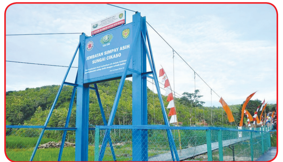
Jembatan Sungai Cikaso yang baru dibangun dan diresmikan.

Dia lebih lanjut menjelaskan bahwa pembangunan jembatan ini menghabiskan dana sekitar Rp500 juta yang berasal dari para donatur. "Pembangunan ini menghabiskan sekitar 500 juta jadi kita sangat bersyukur masih ada donatur pada saat zaman seperti ini pada saat semua kondisi sulit donatur dari kecil dari celengan bambu dari celengan juga itulah yang bisa membuat jembatan ini ada," ungkapnya. • ist