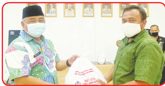
PSMTI Jabar secara simbolis menyerahkan paket sembako kepada perwakilan Kecamatan Ciparay.