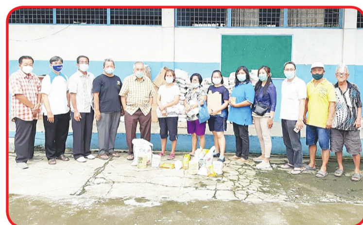
Berfoto bersama di lapangan depan Sekolah Saman Hudi.

Bergandeng tangan melakukan aksi sosial serta membantu pemerintah setempat mensejahterakan masyarakat, ujarnya. • idn/din